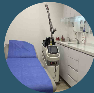
Sala de procedimientos