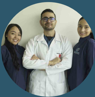
Médico Estético, Auxiliar de Enfermería y Cosmetóloga.