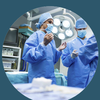
Acceso preferencial a quirófano IQ